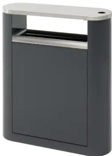
Näidistoode: Extery prügikast Look 30

Bussipeatuse prügikasti välimus ja mõõtmed tuleb enne tellimist ja paigaldamist kooskõlastada Tellijaga. Näidistooteks on risttahukaline ühesektsiooniline prügikast, kaanega, jalal ja tuhatoosiga. Prügikastil peab olema sees eemaldatav sisemine mahuti. Prügikasti jalg ankurdada maapinda. Paigaldada vastavalt Tootja juhisteile.